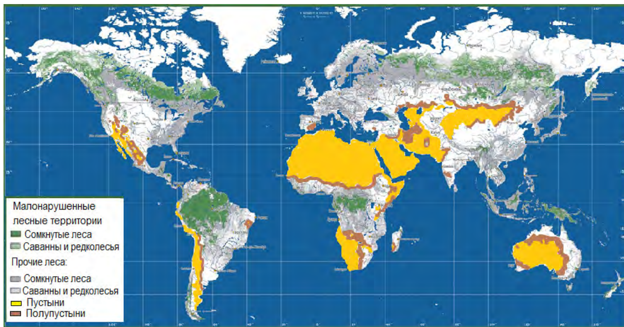
Рис. 2. Географическая карта мира, где зеленым или серым цветом окрашены лесные территории, желтым или коричневым – зоны опустынивания

дарств-распорядителей лесными ресурсами России и незнание ими законов процессов циркуляции вещества и энергии в биосфере, масштабов климатообразующей роли лесов, которая распространяется далеко за пределы государства. Уничтожая леса в России, в т. ч. леса вокруг оз. Байкал, Китай или европейские страны, тем самым, в не меньшей степени наносят также урон климату на своей территории, несмотря на наращивание площади своих лесов. Очевидно, они не осознают единства всей биосферы и ее лесной зоны: чем больше массив леса, тем больше его климаторегулирующий эффект. Леса Европы не выстоят в окружении больших просторов степей и пустынь в России, риск гибели лесов в Китае от уничтожения лесов Северной Азии, на наш взгляд, еще больше.