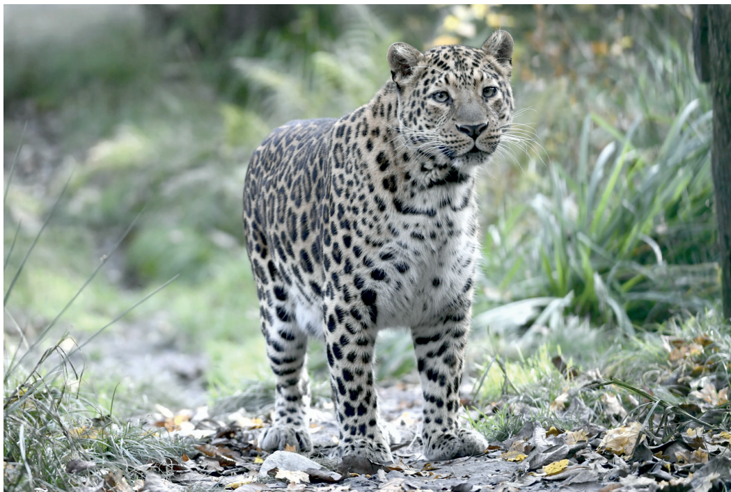
Рис. 1. Самка Panthera pardus tulliana .

татам исследований стало ясно, что на Кавказе переднеазиатский леопард сохранился лишь на самом юге Закавказья в виде небольших очагов, часть которых угасла. Относительно устойчив лишь один очаг на стыке Армении, Азербайджана и Ирана (на стыке отрогов Карадага и Зангезура), поэтому было принято решение о разработке программы реинтродукции леопарда на Российском Кавказе. Такая программа была подготовлена и защищена автором и утверждена Министерством природных ресурсов и экологии РФ в 2007 году [12].